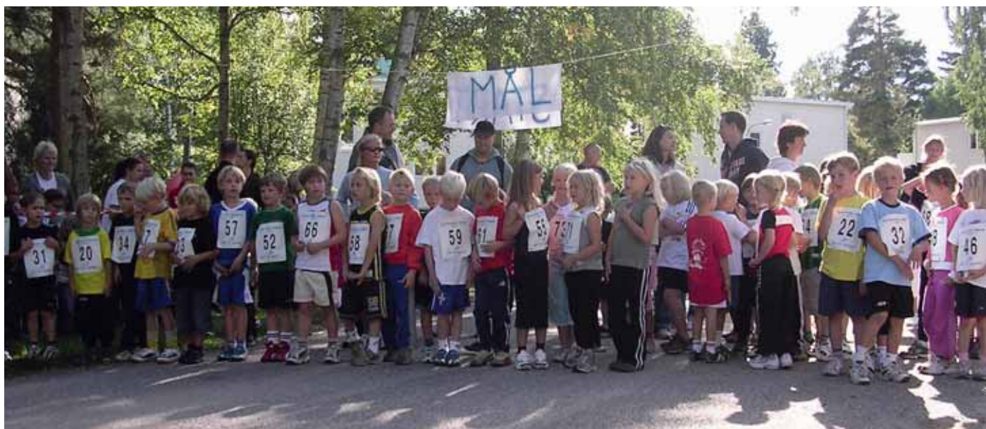
Förhoppningsfulla löpare ur startgrupp ett inför start