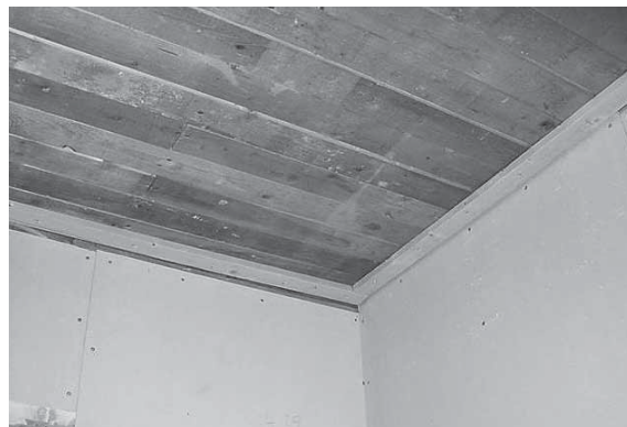
Ramen på plats, dags att spika upp väv.