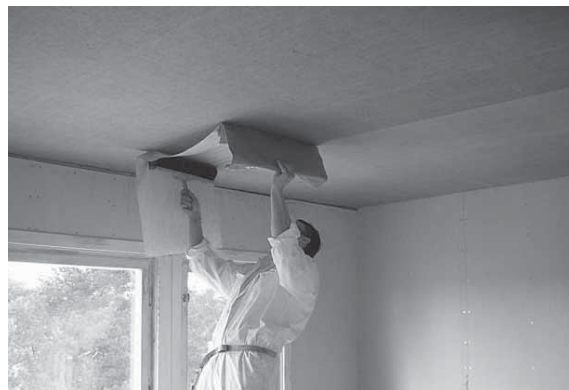
Makulering med "farsans borste".